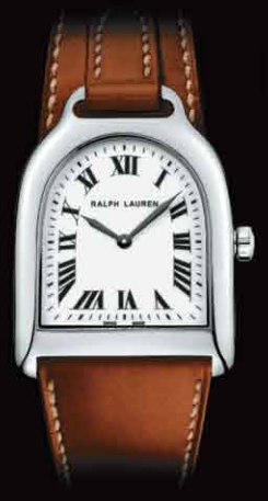
RALPH LAUREN ¥205,000 tax excluded