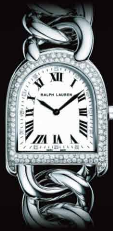
RALPH LAUREN ¥595,000 tax excluded

RIGHT /ラルフローレン スタイラップ コレクション プティモデル スティール